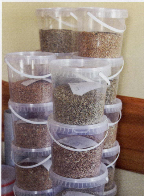
Graudu kvalitātes noteikšanas laboratorijā saglabā noņemtos paraugus gadījumiem, ja saimnieks nepiekrīt analīžu rezultātiem.

iespējas. Melnos graudus var attīrīt ar melno graudu tīrītāju – šādas iespējas ir arī kooperatīvā, tomēr tīrīšanas process ir darbietilpīgs un lēns. Jāņem gan vērā, ka katrā saimniecībā situācija ir atšķirīga.