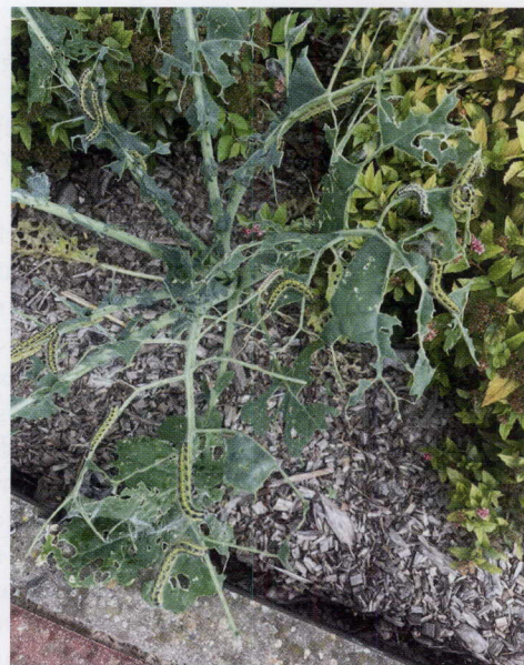
Kāpostu baltenis vienas dienas laikā ir noēdis šajā rudenī sētos rapšus.

kad raža būs gandrīz pārdota. Kāds būs nākamais gads – nezinu, nevēlos par to domāt. Nav viegli plānot augkopībai vajadzīgos pirkumus divus gadus uz priekšu, tas paņēmis ļoti daudz manas enerģijas. Ja graudu cenas pēkšņi kritīsies, minerālmēsli jau ir nopirkti par dārgu cenu. Ja graudu cenas būs stabilas vai kāps, būs tādi paši nosacījumi kā agrāk – aptuveni vienāds izejvielu un graudu un rapšu cenu kāpums. Mierīnu sevi ar domu, ka divi gadi līdzsvarosies (labs un sliktāks) un ienākumu beigās būs tikpat, cik bija agrāk. Uztrauc politiskā situācija, resursu pieejamība – degviela, gāze, elektrība, to cenas, kvalificēta darbaspēka trūkums laukos.