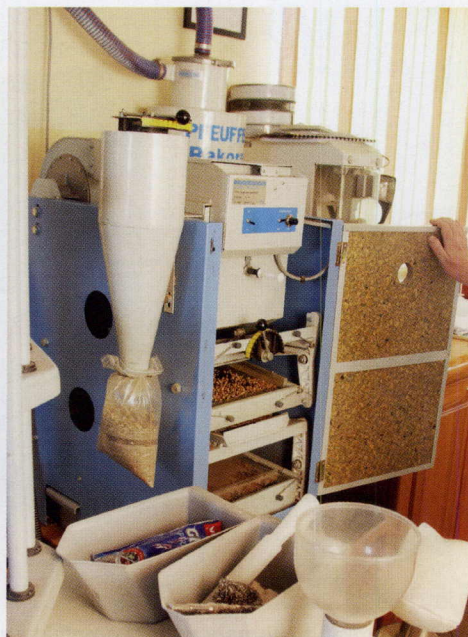
Ar attēlā redzamo Petkus tīrītāju analīžu paraugus vispirms attīra no piemaisījumiem.

Ļoti svarīgs nosacījums ir sējumu apdrošināšana, kas lauksaimniekiem ļauj gulēt mierīgāk.